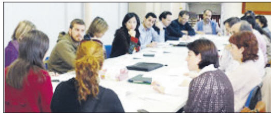
Miembros del Consorcio para la Creación de Empleo Pactem Nord.

Como no podía ser de otra forma, inmersos en la era de la comunicación 2.0, el Consorcio Pactem Nord y Facenord han hecho una decidida apuesta por las