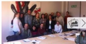
Los municipios atendieron a 4.546 parados y lograron 192 contratos pactem nord

La red de profesionales del Consorcio Pactem Nord celebró una reunión en Massamagrell para coordinar nuevas iniciativas. Asimismo, se informó de los datos definitivos de 2015 según los que se atendieron en los municipios de l'Horta Nord a 4.546 personas desempleadas, enviándose a 1.427 personas a alguna de las 329 ofertas de empleo gestionadas por la red. Se lograron 192 contratos de trabajo.