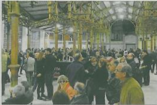
La Feria de la Tapa, celebrada el pasado fin de semana...

Una de las ciudades más comerciales de l'Horta, Burjassot, pone en marcha periódicamente actividades de dinamización de los establecimientos. El Black Friday y la Feria de la Tapa son las últimas.