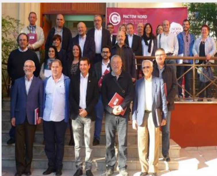
El Consejo Rector de Pactem Nord en una fotografía de archivo.

En la reunión se han tratado diversas cuestiones, entre ellas, la vuelta al consorcio de los ayuntamientos Paterna y Albuixech con los que se mantienen conversaciones. Según se ha informado, el regreso de esos dos consistorios "va por buen camino". En este sentido, se explicó que el Consell quiere impulsar la vertebración del territorio para el desarrollo de proyectos de empleo a través de los Pactos Territoriales incentivando la participación activa en éstos de ayuntamientos y entidades, mediante convocatorias específicas de trabajo.