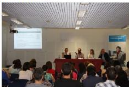
Jornadas formativas en Alboraya. EPDA Pulse en la imagen para ampliar

La acción formativa se ha dirigido a profesionales de entidades que realizan intermediación laboral