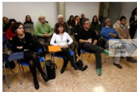
Un curso anterior. Pacte, Nord

El Consorcio Pactem Nord ha puesto en marcha un curso totalmente gratuito para comerciantes de l'Horta Nord sobre conocimiento y uso de Facebook, ya que está considerada la red social más utilizada en el mundo y la que más clientes atrae. Las sesiones se realizan en Vinalesa y Puçol y se desarrollarán hasta el 22 de noviembre. Dada la limitación de plazas sólo se ha admitido una persona por comercio en el curso y tenían prioridad aquellos establecimientos que estén asociados.