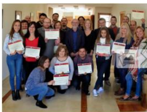
El empresariado valora la formación en atención y ventas

general, la valoración realizada fue positiva, y se ha confirmado que las empresas incrementarán la contratación de alumnado de cara al período navideño. Por parte de las empresas la valoración también ha sido buena pues este curso ha abordado contenidos interesantes asociados al perfil profesional del técnico de ventas y atención al público, de gran aplicación