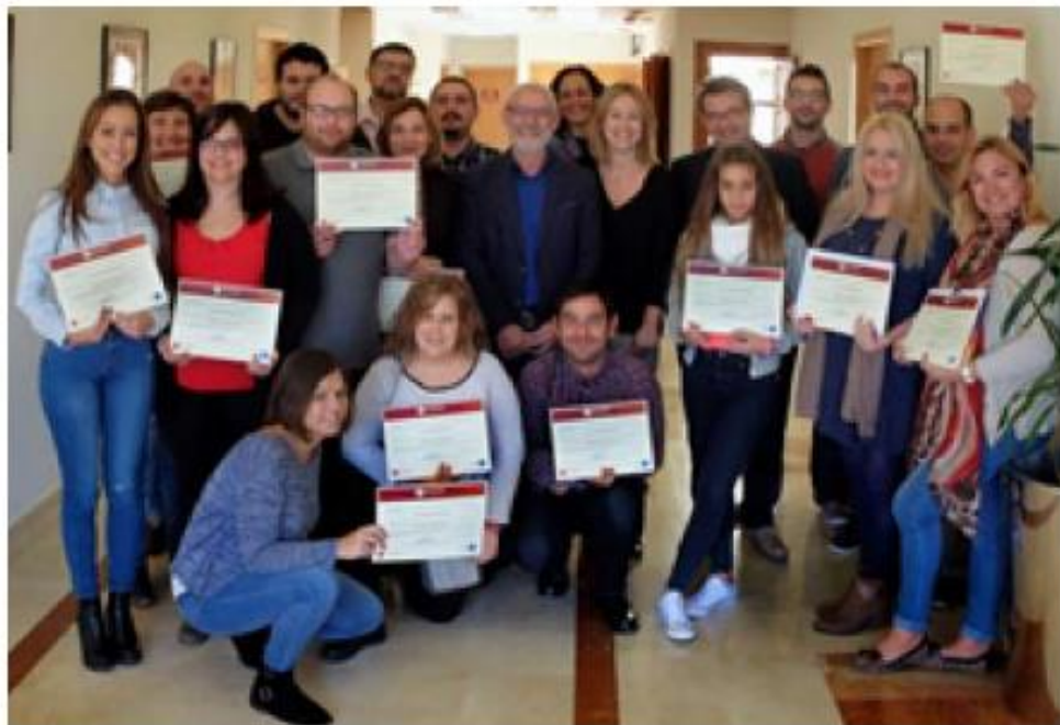
Entrega de diplomas. EPDA. Pulse en la imagen para ampliar

Se ha confirmado que las empresas incrementarán la contratación de alumnos de cara al período navideño