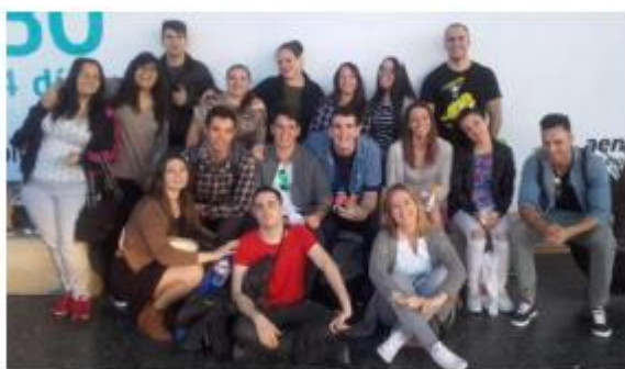
Los participantes en el curso de Pactem Nord, en el aeropuerto. EPDA

Los participantes podrán en práctica los conocimientos adquiridos durante dos semanas en Málaga