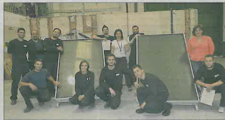
La alcaldesa con los jóvenes del plan para chicos sin formación ni cualificación. A. QUART