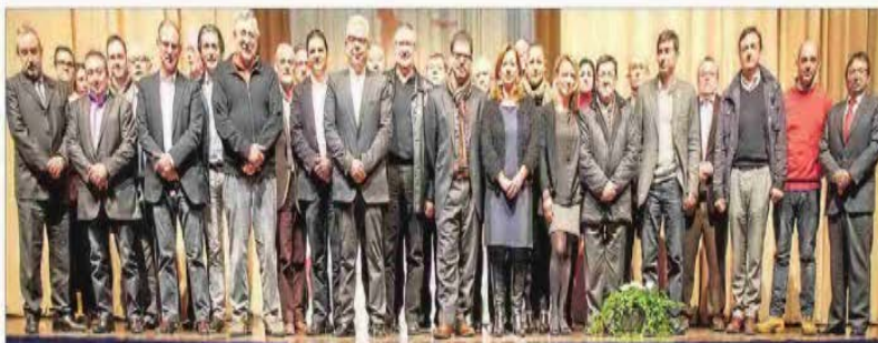
Los firmantes de la renovación del pacto por el empleo en la comarca de l'Horta Nord. PACTEM NORD