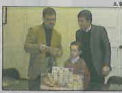
Momento del sorteo.

Compromís por Picasent considera «nefasta» la gestión comercial de la campaña de Nadal realizada por el Ayuntamiento gobernado por el PSOE, con unas iniciativas creadas «de espaldas a las asociaciones comerciales con el único objetivo de la foto y la propaganda». Por ello Compromís exige «unificar esfuerzos para realizar campañas que potencien realmente el consumo en nuestro pueblo» con actividades divertidas y novedosas. L-EMV PICASSENT