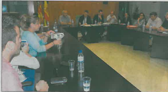
La corporación municipal de Massamagrell en la celebración de un pleno en el Ayuntamiento.

A este marcado carácter social, las ayudas en el área de Bienestar Social ascienden a 90.000€ (una ayuda que en los últimos años, desde que empezó la crisis, se ha duplicado) para ayudar a los vecinos que más lo necesitan. Se suman un paquete de ayudas destinadas a las familias que repercutirán al mismo tiempo en el comercio local. Ayudas familiares como el cheque bebé, la del material escolar, becas a la excelencia y becas para universitarios y para estudiantes de ciclos formativos que ascienden a