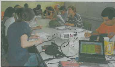
Una de las jornadas formativas del Pactem Nord. PACTEM