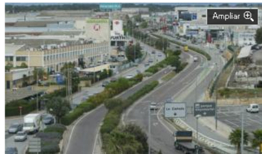
L'Horta Nord creció en 2.317 empresas en ocho años por el tirón del sector servicios