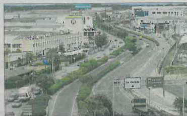
Paterna tiene la mayor concentración de polígonos. A. COMES

Fuente: Pactem Nord, Tesorería General de la Seguridad Social, septiembre de 2014.