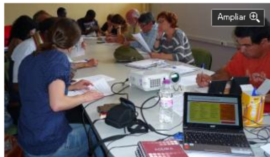
Pactem Nord inserta a 154 parados y ayuda a crear 34 nuevas empresas en 2014