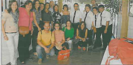
Los técnicos y usuarios de Incorpora durante una jornada.

Un buen ejemplo de este modelo reside en el programa de integración laboral de la Obra Social la Caixa, Incorpora, que ha facilitado en la provincia de Valencia 528 puestos de trabajo a personas vulnerables a lo largo de 2014, frente a los 385 de 2013. Conviene indicar la gran labor de los 24 profesionales de las entidades implicadas en el desarrollo del citado programa,