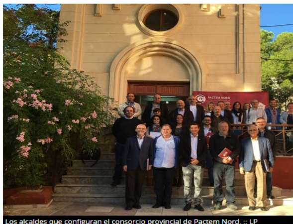
Los alcaldes que configuran el consorcio provincial de Pactem Nord.

Por último, el presidente quiere destacar que en Pactem «la máxima prioridad es el empleo, y nos implicaremos todos independientemente del color político que tengamos». El consorcio, integrado por ayuntamientos, sindicatos y asociaciones empresariales, apuesta por vertebrar políticas de formación y posterior inserción laboral, así como por proyectos de inserción a los colectivos en exclusión social.