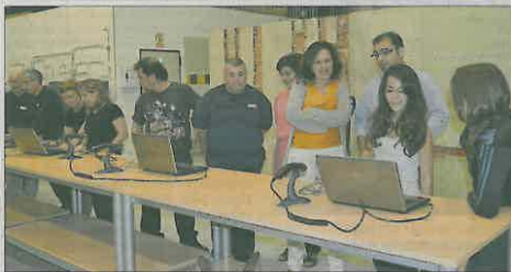
Asistentes al curso de auxiliar de almacén en Quart de Poblet. A. QUART

Otras líneas de trabajo de carácter transversal que potencian la vertebración del territorio, como son el observatorio socioeconómico, con la emisión anual de informes especializados sobre la evolución del mercado de trabajo, la igualdad de oportunidades entre mujeres y hombres, la promoción y protección medioambiental de l'Horta Nord a través de la recuperación de suelo agrícola, la plataforma de empresas y emprendedores en la que se registran 205 empresas (desde la que se puede localizar a proveedores locales) y la web de turismo en l'Horta Nord, en la que se recogen los recursos turísticos comarcales, dotan al trabajo de la entidad de un enfoque integrado y de la complementariedad necesaria con los recursos del territorio para abordar la problemática del desempleo.